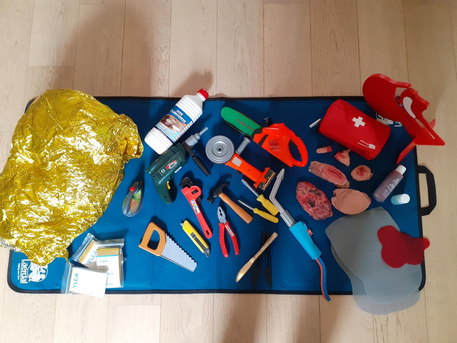
Matériel pour la simulation des accidents